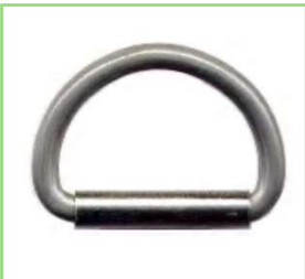
21*3並半月パイプ巻き